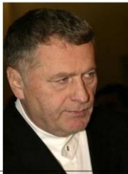
Владимир Вольфович Жириновский

Радикальная партия, выступающая за сильное государство, которому должны быть подчинены интересы всех его граждан.