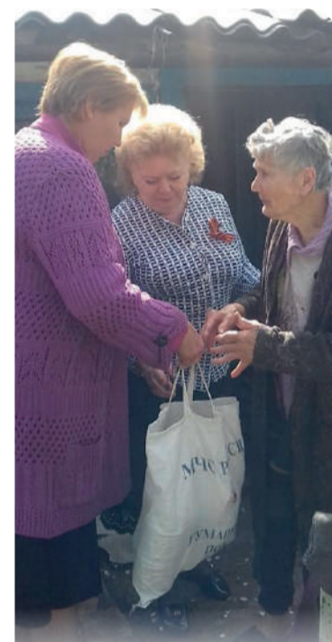
Активисты оказывают поддержку нуждающимся

Весной у нас проводилась акция «Очистим планету от мусора». В ней приняли участие жители посёлка. Таким образом, крепчане внесли свой вклад в благородное дело охраны при-