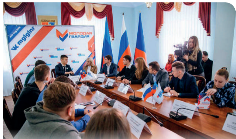
Встреча активистов проекта «Молодая Гвардия» с активом «Молодой Гвардии Единой России»