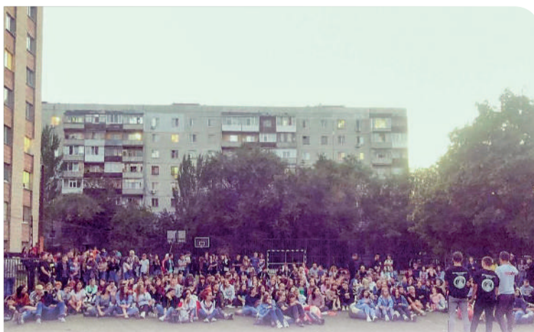
Активисты проекта устроили кинопоказ для студентов в Луганске

Ещё мы провели конкур эссе «Я – Глава Республики на один день». Было написано более тысячи работ. Сейчас мы начинаем работать над идеями, предложенными ребятами, возможно, мы передадим их в Молодёжный парламент ЛНР, чтобы молодёжные инициативы проработали в законодательной части. Также мы черпаем из этих эссе идеи для наших акций. Например, очень многие ребята писали по поводу восстановления детских площадок. К тому же мы проводим тренинги личностного роста для молодёжи.