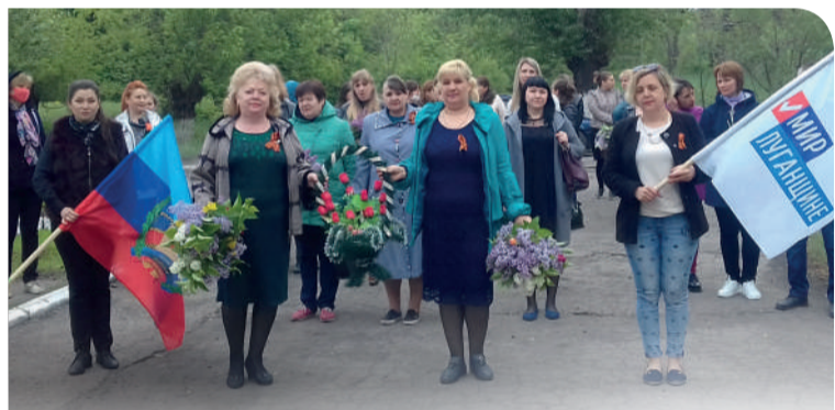
В посёлке свято чтут память и подвиг народа-победителя

Безусловно, мы заботимся о нашей речке Крепенской. Мы регулярно проводим субботни-