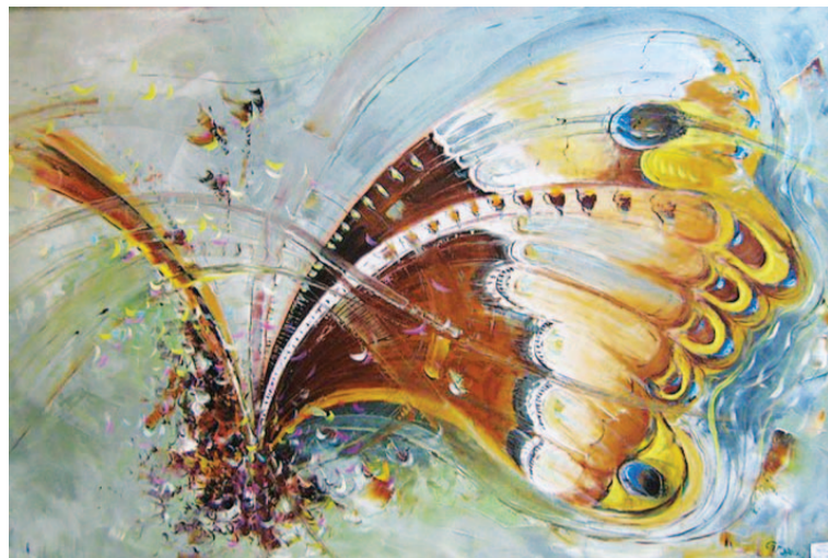
Стегэреску Т. «Бабочка».

– Если бог дал талант – нужно работать, и не просто работать, а пахать. Похвалили.