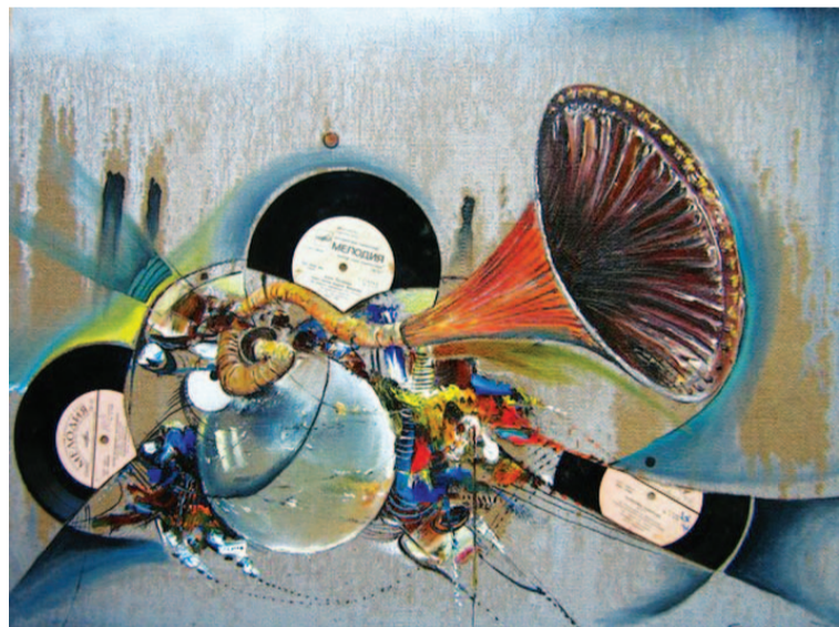
Стегэреску Т. «Мелодия».

Заметили. Купили. И молодой художник уже чувствует себя звездой. Но деньги не главное в живописи.