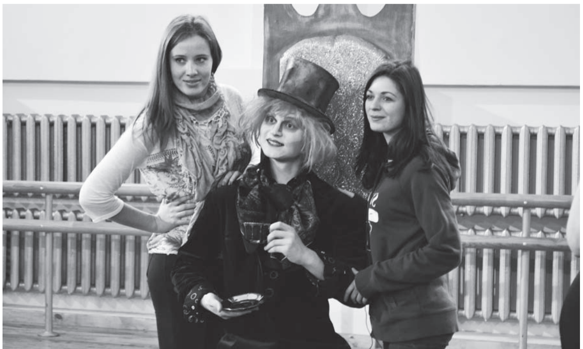
Фото Анастасии Кляхиной, ОМФ-1

Авторами коллекций стали преподаватели, студенты и выпускники кафедры художественного моделирования одежды ЛГАКИ.