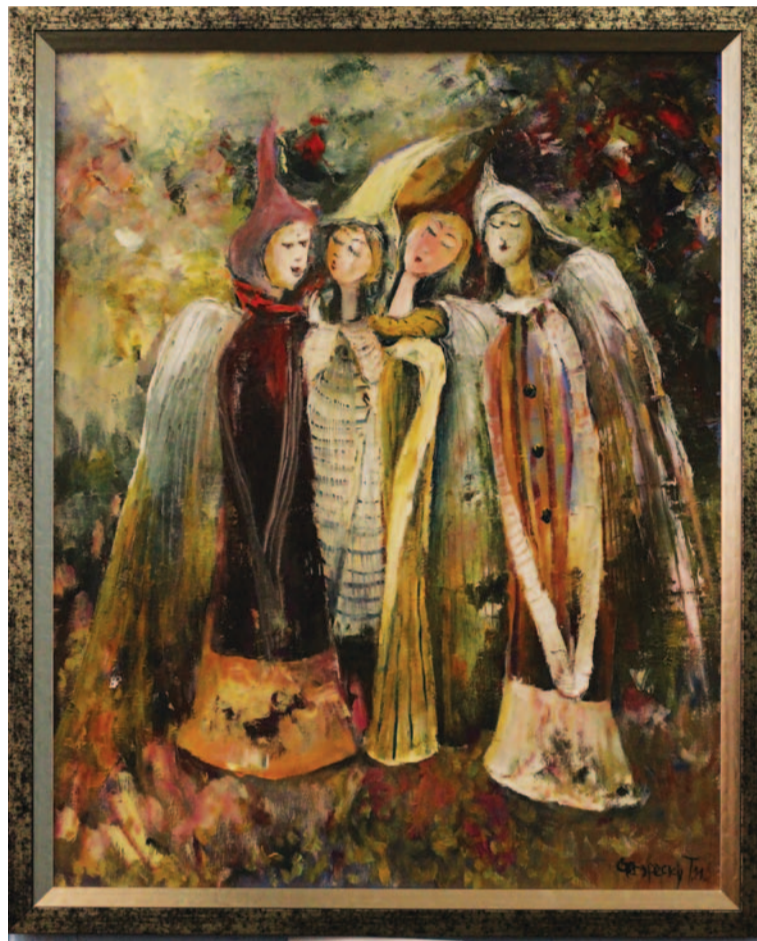
Стегэреску Т. «Поющие Ангелы». Фото Ильи Волкова, ОМФ-1