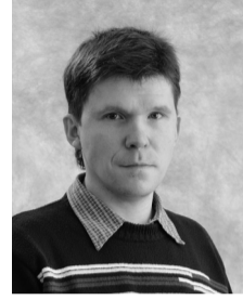
«Все просто и выполнимо»

7. Я бы посоветовал первокурсникам найти золотую середину между учебой и отдыхом, не стоит впадать в крайности, тогда и шторм по имени «сессия» не будет страшен, и в памяти останутся не только одни учебники.