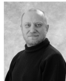
«Над проблемами возвышался, нервы берег, «хвостов» не имел»

7. Первокурсникам хочу пожелать прежде всего, чтобы их не «штормило» во время сессии. Сейчас у вас самое замечательное время, чтобы мечтать и со временем воплощать свои мечты в реальность, ставьте цели, будьте настойчивыми, не ленитесь и у вас все получится. Радуйтесь жизни, а радуясь, не забывайте учиться :)