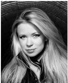
«Гастроли, концерты, фестивали — ярко и весело»

7. «Бороться и искать, найти и не сдаваться». Самое главное — всегда помнить, что, чем больше будет багажа знаний, тем легче будет в дальнейшем. Работодатель смотрит не на цвет диплома, а на умение качественно и быстро работать.