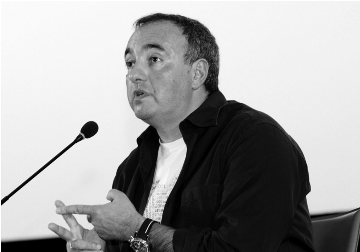
Творча зустріч з Олександром Роднянським в форматі питання-відповідь

У своєму екскурсі в фестивальне літо не маю право не сказати окремо про предмет зустрічі — фільми. Всі вони були представлені в декількох категоріях (на всяк випадок проілюструю деякі з них): «Міжнародна конкурсна програма» (гран-прі за кращий фільм здобув «Географ глобус пропив», який обов'язково слід подивити-