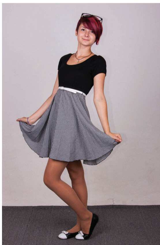
Фото Александры Волчанской, а на фото студенты 1 курса ОМФ-1