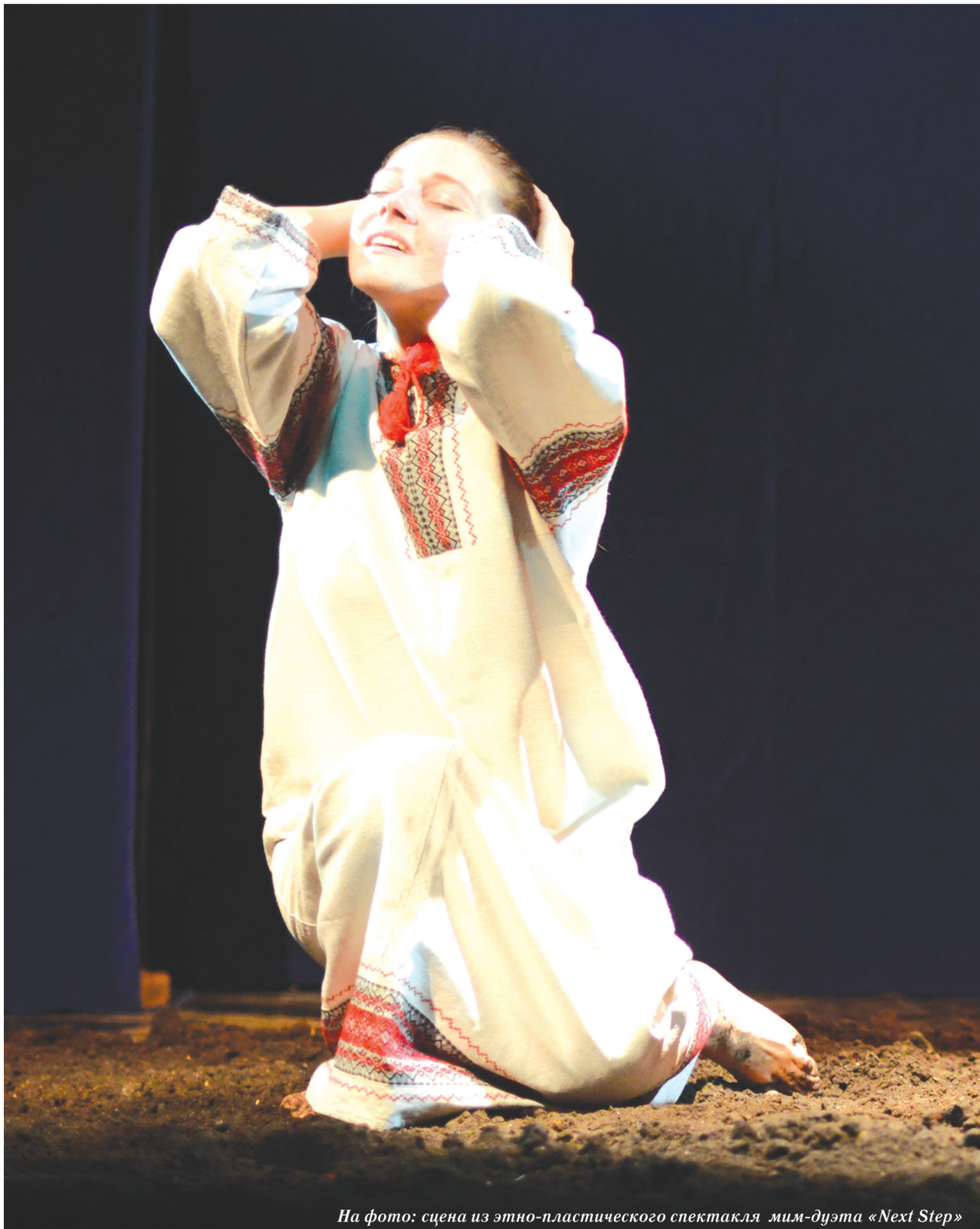
На фото: сцена из этно-пластического спектакля мим-дуэта «Next Step»

Юные цирковые артисты из 20 стран мира сразились за звание лучших на фестивале «Цирковое будущее» в Луганске.