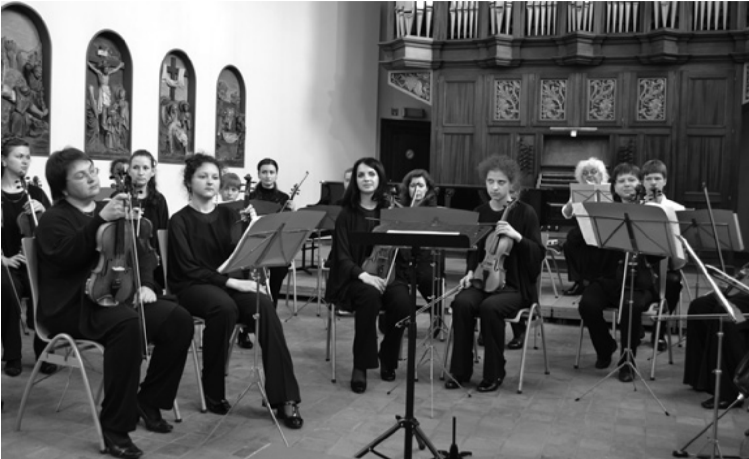
На фото камерный оркестр «Серенада» на гастролях.