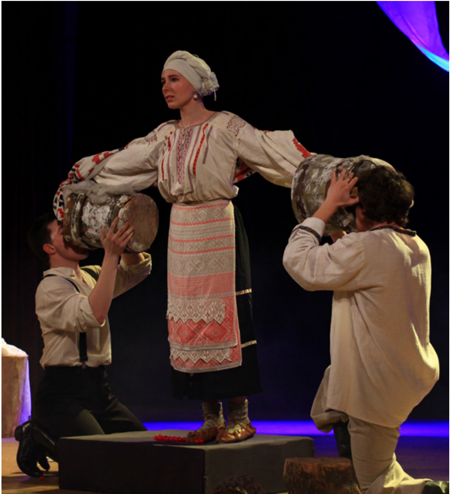
Спектакль «Гришні» по пьесе Ивана Франко «Украдене щастя»

Сессия – это не только зачеты и экзамены, это еще и приколы!