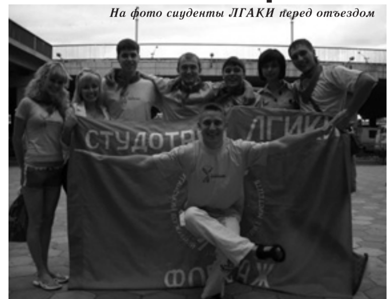
На фото студенты ЛГАКИ перед отъездом

Мы желаем ребятам новых трудовых свершений и незабываемого отдыха и будем ждать рассказа о «Форсаже 2013»