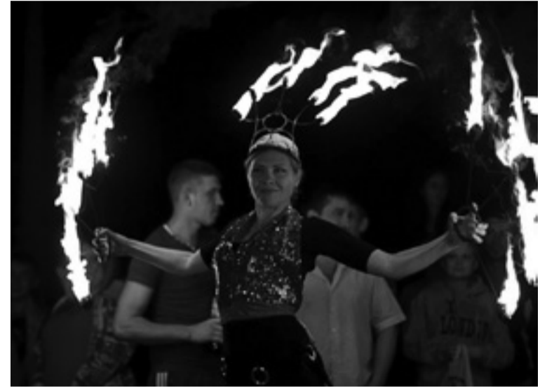
Театр огня «Т-Jazz», сочетающий в себе хореографию, цирковое жонглирование, акробатику и театральное мастерство.