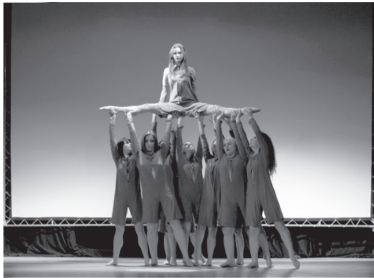
Спектакль «Облить жизнью»

Танец — это не только зрелище, но и способ выражения своих мыслей и чувств. Не зря молодежь нынешнего поколения все свободное время проводит в движении под ритмы самых разных стилей и направлений.