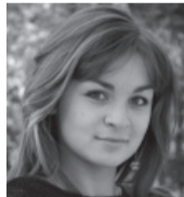
Опрос провела Татьяна Чесалова, КДВ-2

Вернее, с кем из известных личностей хотели бы встретиться наши студенты, если бы такая возможность представилась в рамках уже сложившейся традиции — приглашать в институт выдающихся представителей творческих профессий. На этот вопрос собирала ответы наш корреспондент.