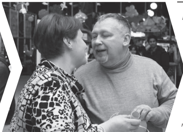
Сказать «Люблю» – займет секунду, показать – всю жизнь

День святого Валентина или День всех влюбленных — праздник, который 14 февраля отмечают многие люди по всему миру. Традиция празднования дня св. Валентина как «дня влюбленных» закрепилась под влиянием английской и французской литературы с конца XIV века. Народное поверье о том, что в этот день птицы начинают поиск своей пары, нашло отражение в творчестве «отца английского литературного языка» Джеффри Чосера в его знаменитой поэме «Птичий парламент».