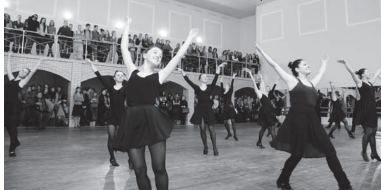
В полете радости