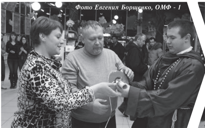
Фото Евгения Борщенко, ОМФ - 1