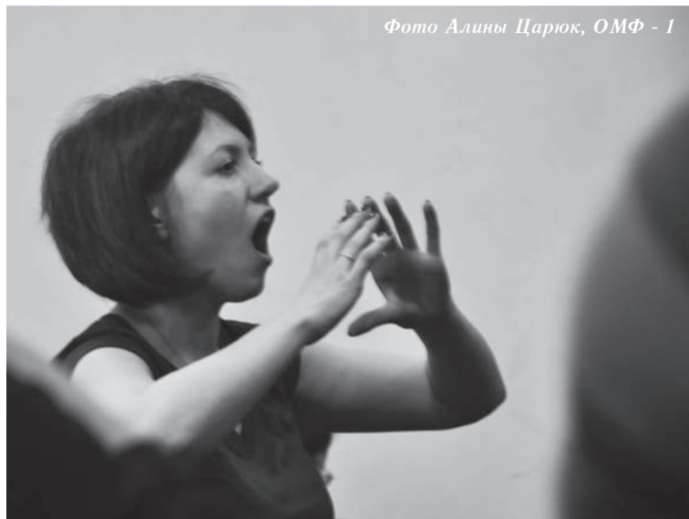
Фото Алины Царюк, ОМФ - 1

Гладилина «Фотоаппараты». Актеры — студенты IV курса специальности «Актер драматического театра и кино» представили на суд зрителей