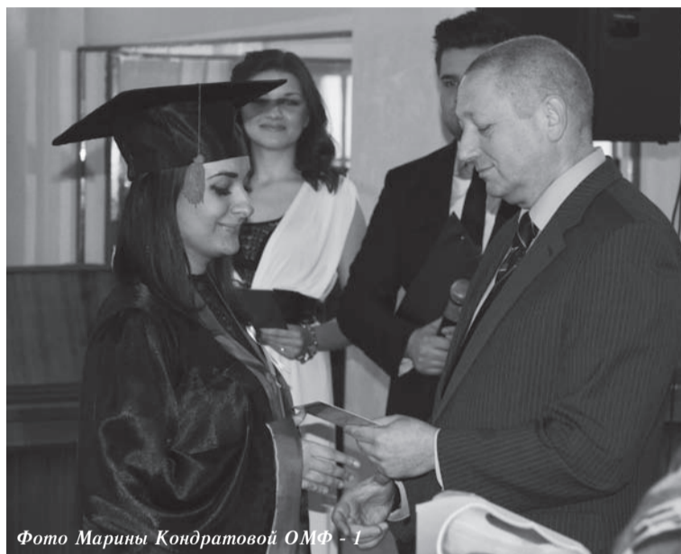
ОМФ - 1

В ЛГАКИ 9 февраля 2013 г. состоялась торжественная церемония вручения магистерских дипломов по специальностям «Музыкальное искусство», «Театральное искусство», «Книговедение, библиотековедение и библиография».