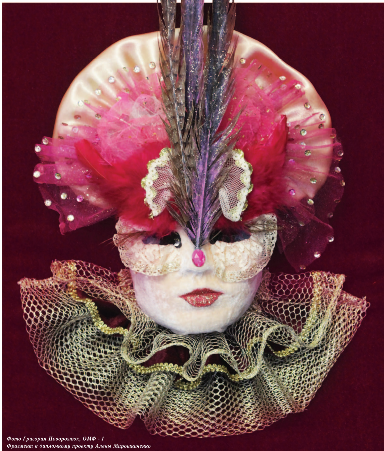
Фото Григория Поворознюк, ОМФ - 1 Фрагмент к дипломному проекту Алены Мирошниченко

Выставка кафедры художественного моделирования одежды «Венецианские маски»