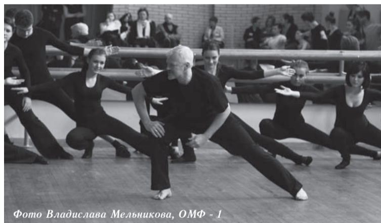
Фото Владислава Мельникова, ОМФ - 1

историю о двух еще не рожденных детях. Одному из них не суждено было появиться