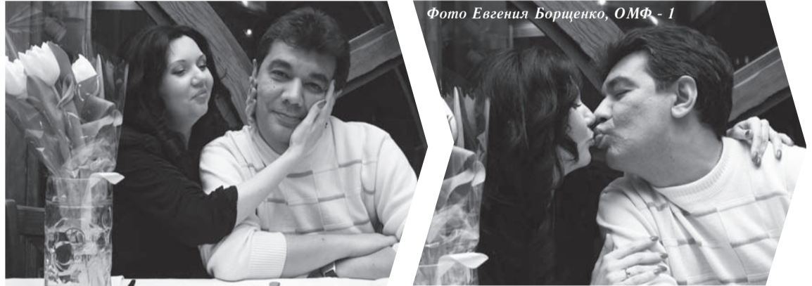
Фото Евгения Борщенко, ОМФ - 1

Участники игровой программы получили в подарок авторские «Валентинки» от студентов кафедры художественного моделирования одежды и художественной фотографии ЛГАКИ.